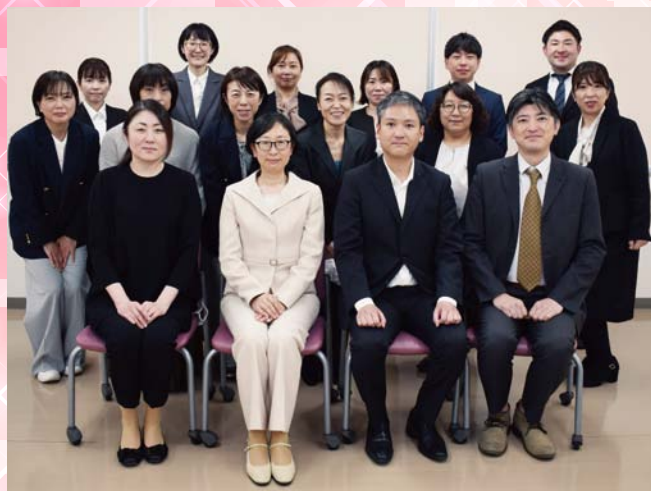
▲ケースレポート発表会(2/20)

2023年4月感染管理認定看護師教育課程を開講、2024年2月には本課程の集大成である「ケースレポート発表会」を開催しました。発表会では実習指導者、受講生の所属施設の方々に参列いただきました。そして、3月21日受講生6名、無事に閉講式を迎えることができました。今後の活躍を期待しています。また、4月10日に2024年度開校式を迎えました。2024年度の受講生は13名です。専門的な知識や技術を習得してAMGや地域に貢献できる人材の育成を目指します。